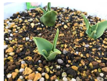
我が家のチューリップ