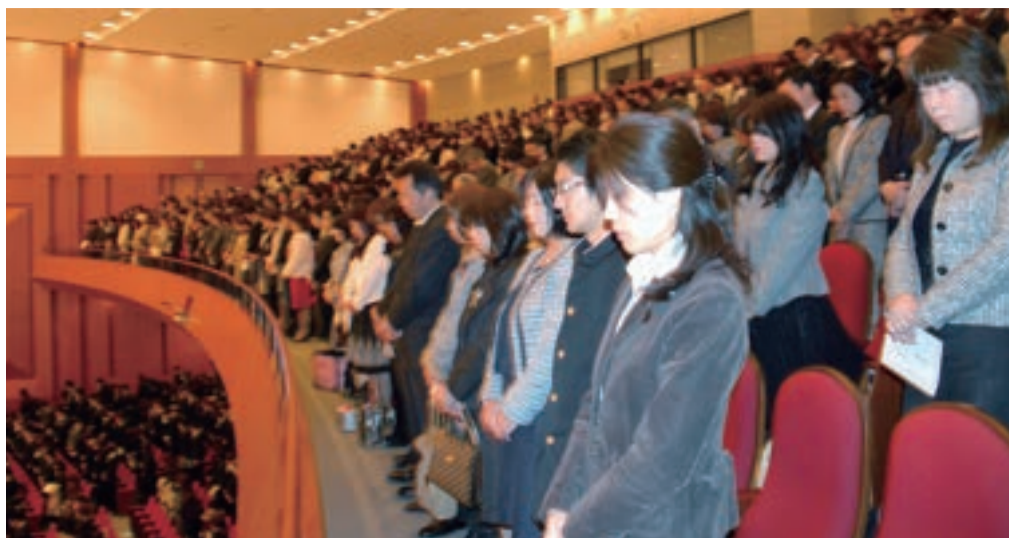
東日本大震災の犠牲者に対し、2階席では保護者も黙とう