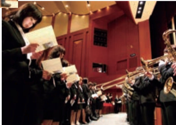
真剣な表情で初めての学歌音唱