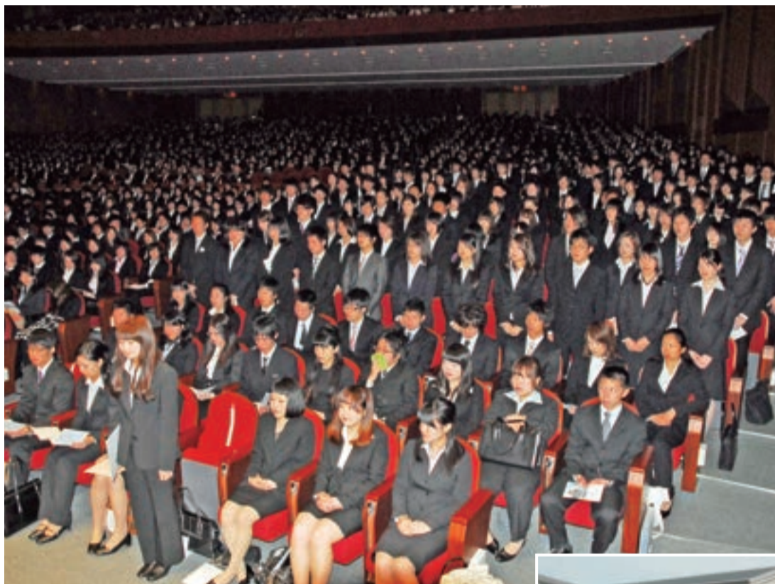
入学式で勢ぞろいし、起立する英語キャリア学部の1期生

2011年度の大学院、大学、短期大学の入学式が4月2日、中宮キャンパスの谷本記念講堂で行われた。今春開設され、1期生を迎えた英語キャリア学部の123人をはじめ、新入生総勢4005人が新たな大学生活のスタートを切った。式に先立ち、東日本大震災の犠牲者を悼んで黙とうした。 新入生の内訳は、英語キャリア学部のほかには、大学院博士課程前期19人、外国語学部1661人（英米語学科1353人、スペイン語学科308人）、国際言語学部771人、短大部英米語学科990人。3年次編入学は外国語学部英米語学科335人、スペイン語学科7人、国際言語学部99人。 式は午前9時半から、大学院と英語キャリア学部、国際言語学部、学部編入学、正午から外国語学部、午後2時半から短期大学の3回に分けて行われた。