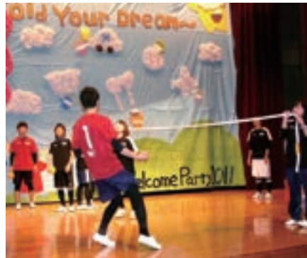
セバタクロール同好会のナイスキック