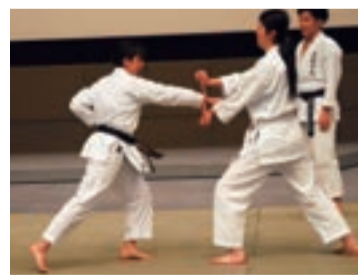
演武祭で板割りを披露する空手部の女子部員