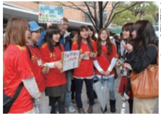
私たちがサッカーを楽しもうと呼び込む吉田蹴球団のメンバー