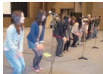
混声合唱団「ラベリテ」のパフォーマンス