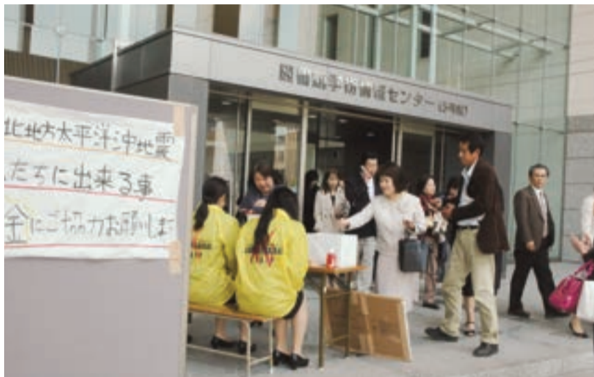
大震災へ募金を行う父母ら

待ちに待ったキャンパスライフがいよいよ、始まります。みなさんがあらゆることに、貪欲にチャレンジし、2年後のセカンドステージへ向け、また未来の夢の実現に向けて、大きく、大きく成長されることを願っています。