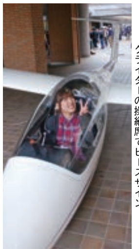
グライダーの操縦席でピースサイン