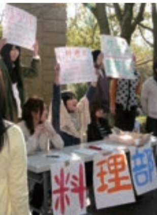
「手作りクッキーをどうぞ」と声をあげる料理部員