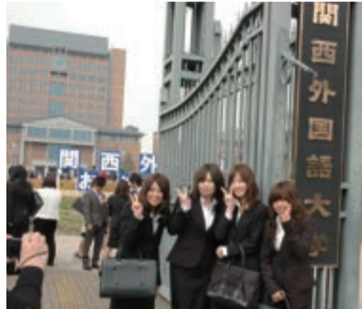
正門へ第1歩。その前にハイ! 記念写真