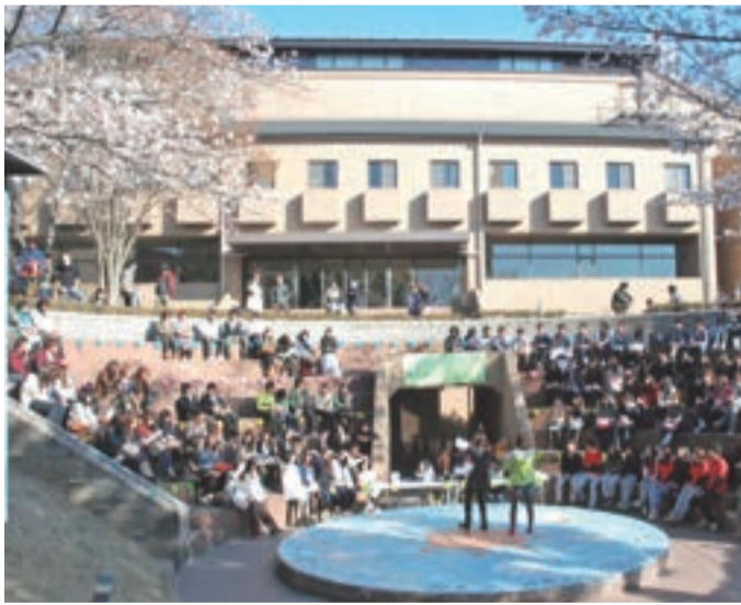
満開のサクラの下に集う新入生