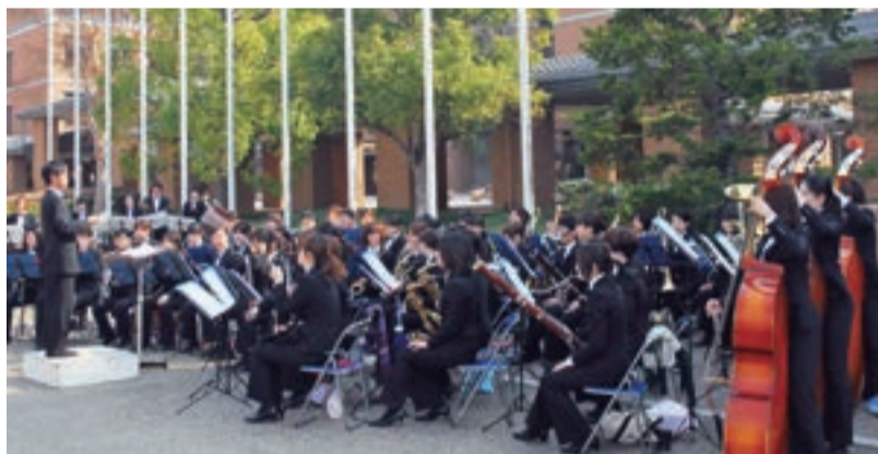
入学式会場前で軽やかなサウンドを響かせる吹奏楽部