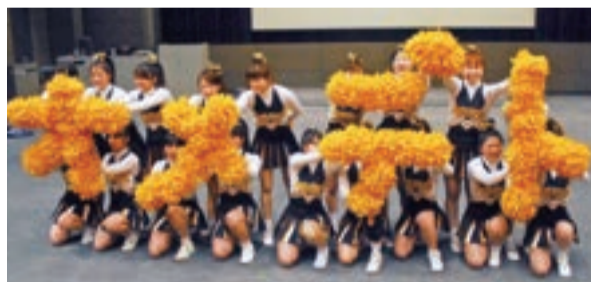
①チアリーダー部「パイレーツ」がポンポンで文字を作って祝福 ②華麗なステップをみせる競技ダンス部のペア ③大迫力のロックバンド演奏