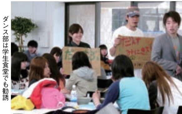
ダンス部は学生食堂でも勧誘