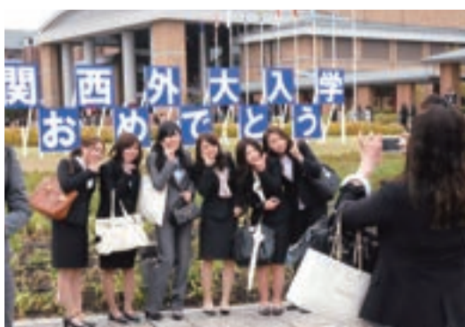
「おめでとう」看板の前でピースサイン