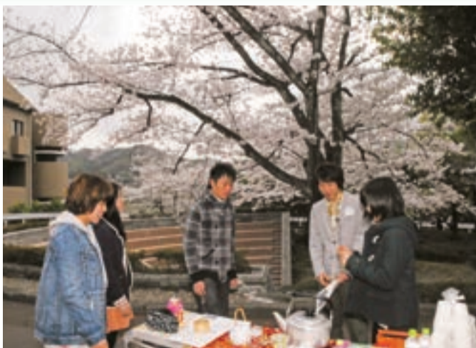
熱心に新入生に入学を勧誘(学研都市キャンパスで)

新入生歓迎祭は、学研都市キャンパスが4月3日、中宮キャンパスが7日に相次いで行われた。新入生たちは各クラブの熱心な勧誘を受け、これから始まる学生生活への期待に胸をふくらませている。 講堂でクラブや学友会の紹介が行われたほか、キャンパスでは各クラブのブースが並び、思い思いの衣装や工夫を凝らしたプラカードで新入生を勧誘。「いろんなクラブがあって、目移りしそう」と、先輩たちの説明に耳を傾ける姿が見られた。 満開の桜の下で開かれた学研都市キャンパスでは、先輩が新入生たちのいろいろな質問に答える相談コーナーも開設した。 前日の嵐が収まった中宮キャンパスでは、競技ダンス部やチアリーダー部「パイレーツ」の華麗な演技が披露され、大きな歓声がわいていた。