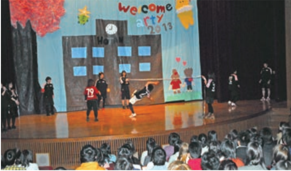
講堂の舞台上で宙に舞い、アタックするセバタクロ部のデモンストレーション