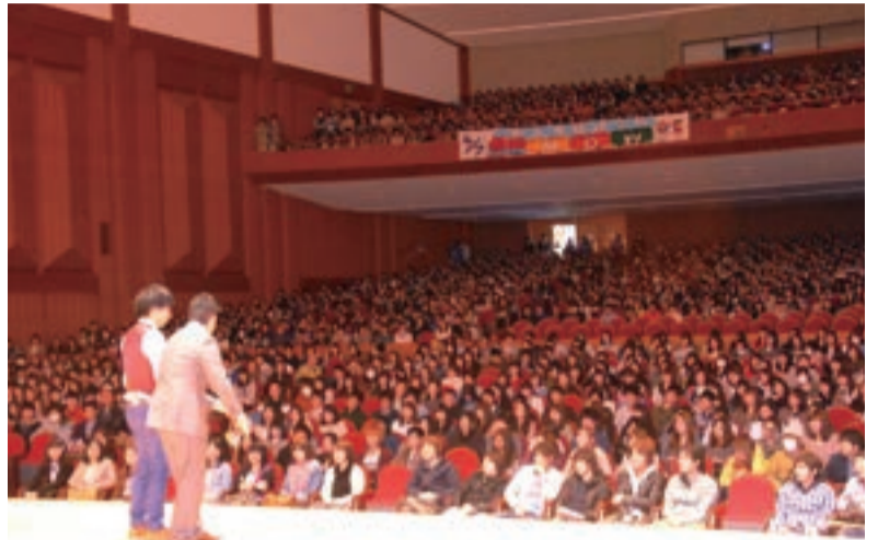
谷本記念講堂いっぱいの新入生を前に、「藤崎マーケット」が懐かしの「ラララライ体操」を織り交ぜながらクラブ・サークル紹介の進行を務めた