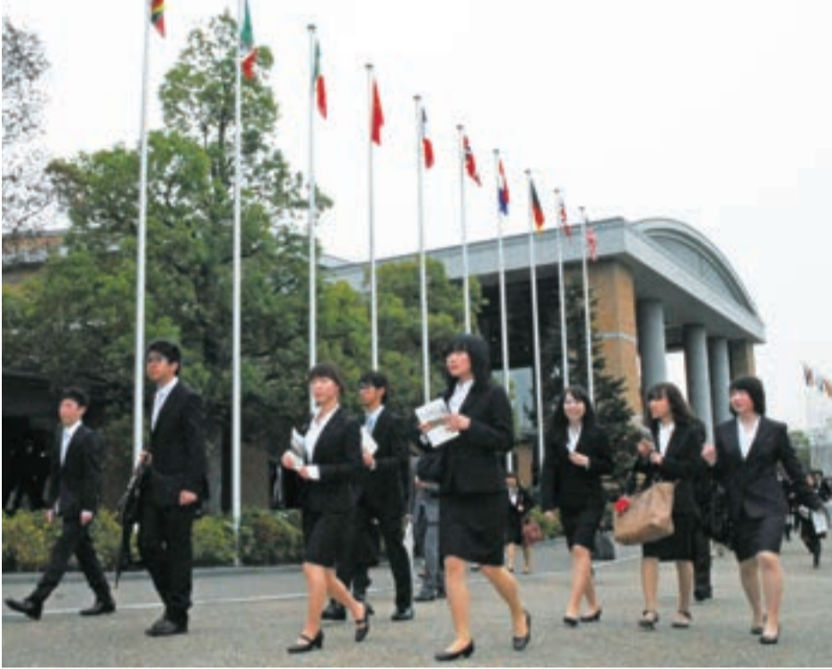
入学式を終え、しっかりと歩む新入生たち(中宮キャンパスで)

新入生の内訳は、大学院博士課程前期13人、同後期1人、英語キャリア学部153人(英語キャリア学科124人、英語キャリア学科小学校教員コース29人)、外国語学部1633人(英米語学科1336人、スペイン語学科297人)、国際言語学部789人、短期大学部1008人。3年次編入学は外国語学部英米語学科329人、スペイン語学科12人、国際言語学部79人。 式は、午前9時半から大学院、英語キャリア学部、英語キャリア学部英語キャリア学科小学校教員コース、国際言語学部、学部編入学。正午から外国語学部。午後2時半から短期大学部の順に3回に分けて行われた。 いずれの式も、吹奏楽部の伴奏で混声合唱団「ラベリテ」が学歌を斉唱。小