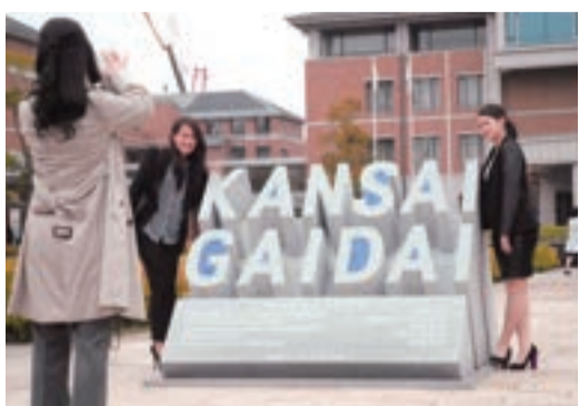
モニュメント前でもパチリ