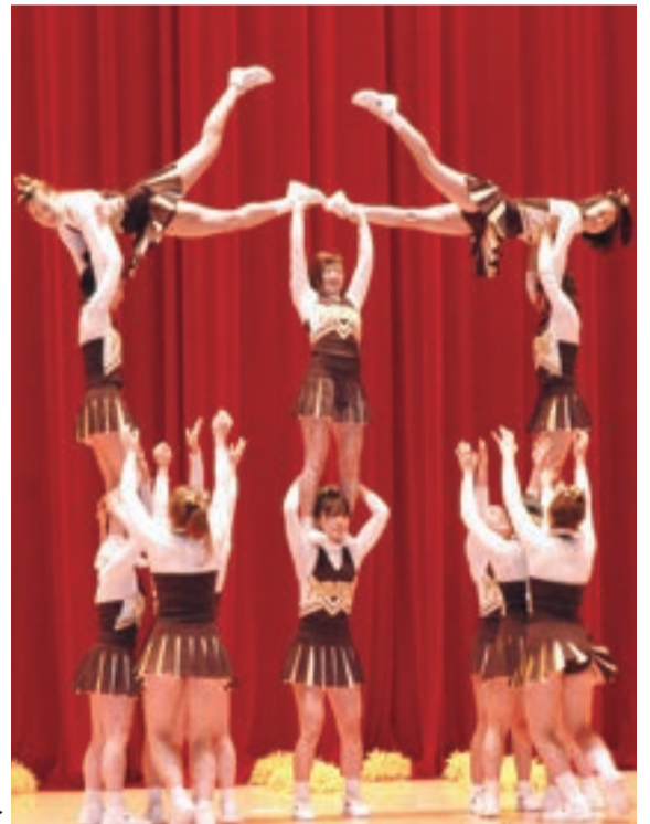
競技ダンスの華麗な演舞に圧倒され、見入る新入生ら