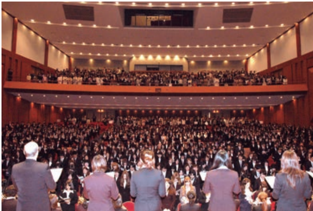
新入生、保護者とともに起立して学歌斉唱