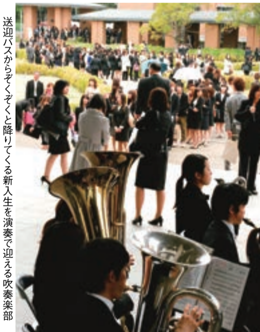
送迎バスからぞくぞくと降りてくる新入生を演奏で迎える吹奏楽部