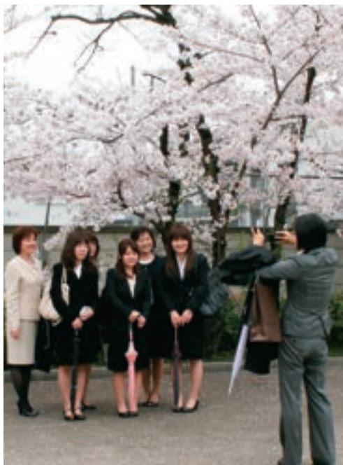
満開のサクラの下で保護者と記念写真に収まる新入生