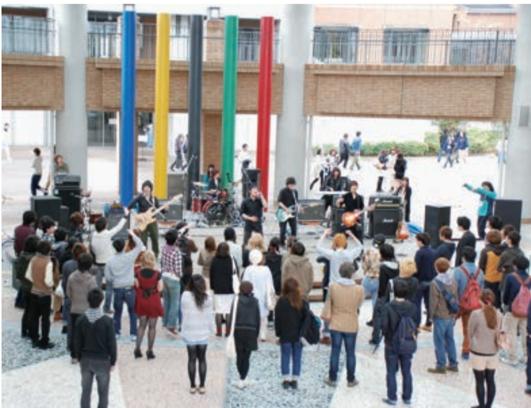
バンドの大音量に合わせてリズムを刻む