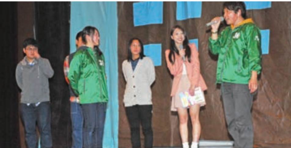
抽選会で入賞し、司会の先輩からインタビューを受ける新入生4人