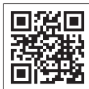
[御殿山キャンパス・グローバルタウンへのアクセス]

[御殿山キャンパス・グローバルタウン] 〒573-1008 大阪府枚方市御殿山南町6-1 TEL: 072-805-2701(代表) [中宮キャンパス] 〒573-1001 大阪府枚方市中宮東之町16-1 TEL: 072-805-2801(代表)