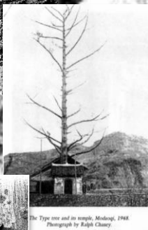
The Tuya tree and its temple, Midway, 1948